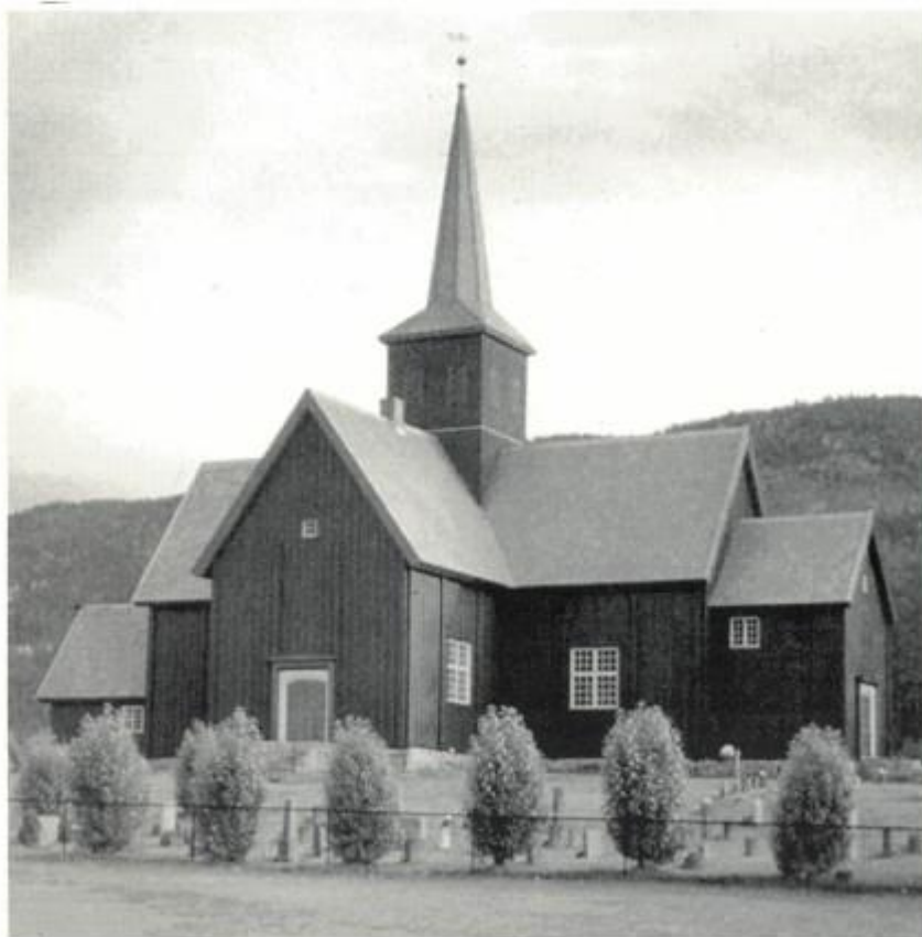
Nordsinni kirke Se artikkel s. 280